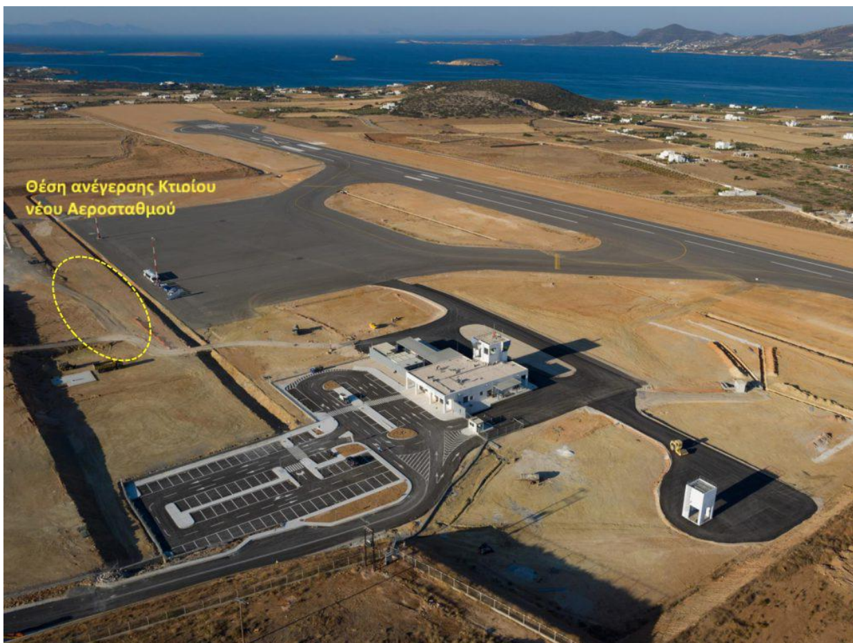
Φωτογραφία 3: Άποψη ΚΑΠΑ προς Ν. Διακρίνονται ο Διάδρομος, οι προσωρινές κτιριακές εγκαταστάσεις, οι θέσεις στάθμευσης, το δάπεδο στάθμευσης αεροσκαφών, οι τροχόδρομοι και η θέση ανέγερσης του κτιρίου του νέου αεροσταθμού