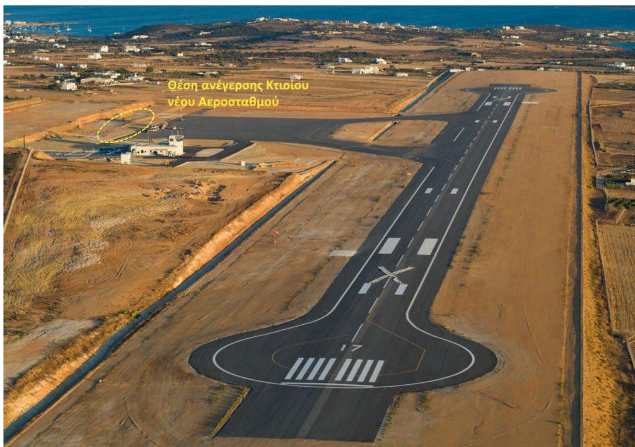
Φωτογραφία 2: Άποψη ΚΑΠΑ προς Ν. Διακρίνονται ο Διάδρομος, οι τροχόδρομοι, το δάπεδο στάθμευσης αεροσκαφών, οι προσωρινές κτιριακές εγκαταστάσεις και η θέση ανέγερσης του κτιρίου του νέου αεροσταθμού