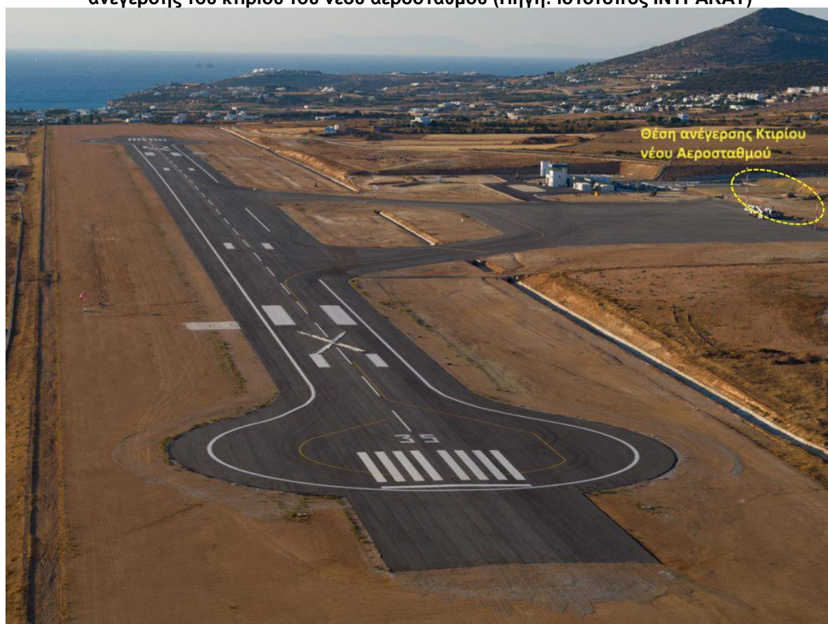
Φωτογραφία 4: Άποψη ΚΑΠΑ προς Β-ΒΑ. Διακρίνονται ο Διάδρομος, οι τροχόδρομοι, το δάπεδο στάθμευσης αεροσκαφών, οι προσωρινές κτιριακές εγκαταστάσεις και η θέση ανέγερσης του κτιρίου του νέου αεροσταθμού