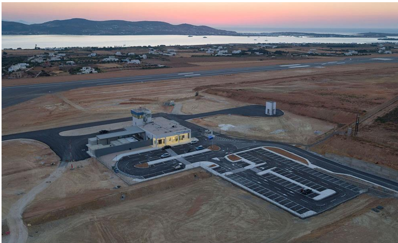
Φωτογραφία 5: Άποψη υφιστάμενων κτιριακών εγκαταστάσεων ΚΑΠΑ προς Δ. Διακρίνονται το προσωρινό κτίριο του αεροσταθμού, ο χώρος στάθμευσης, ο υδατόπυργος και ο Διάδρομος