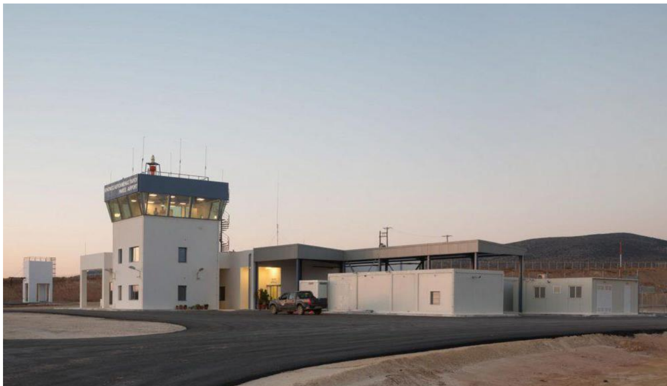
Φωτογραφία 7: Άποψη του προσωρινού κτίριο του αεροσταθμού προς Β