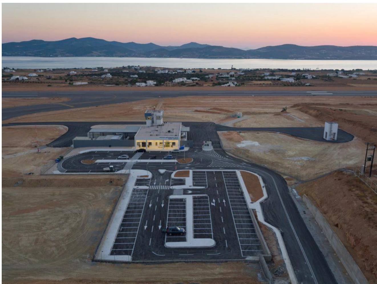
Φωτογραφία 6: Άποψη υφιστάμενων κτιριακών εγκαταστάσεων ΚΑΠΑ προς ΝΔ. Διακρίνονται το προσωρινό κτίριο του αεροσταθμού, ο χώρος στάθμευσης, ο υδατόπυργος και ο Διάδρομος