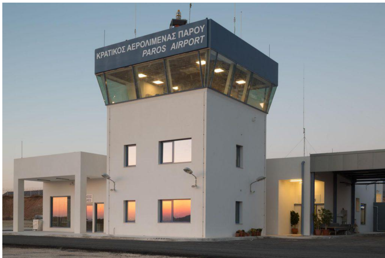
Φωτογραφία 9: Άποψη του προσωρινού κτίριο του αεροσταθμού προς ΒΑ