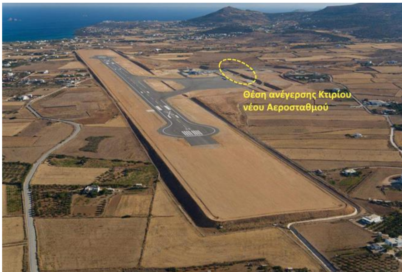
Φωτογραφία 1: Άποψη ΚΑΠΑ προς Β-ΒΑ. Διακρίνονται ο Διάδρομος, οι τροχόδρομοι, το δάπεδο στάθμευσης αεροσκαφών, οι προσωρινές κτιριακές εγκαταστάσεις και η θέση ανέγερσης του κτιρίου του νέου αεροσταθμού